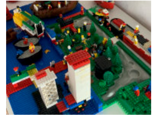
„Stadtansicht mit Hafen“