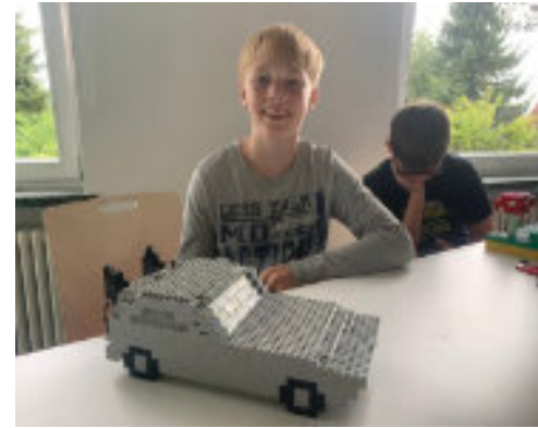
Ganz klar: Der DeLorean aus „Zurück in die Zukunft“