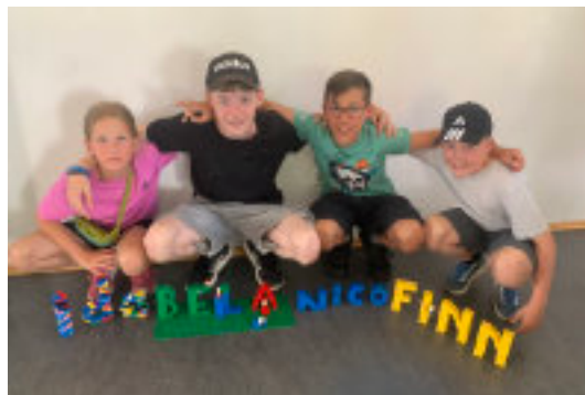
Wer Lego hat, braucht keine Kulis: Sehr gern wurde dieses Jahr der eigene Name erbaut.