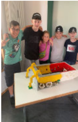
Gegensätze überwinden durch gewagte Architektur: Links Dortmund, rechts München.