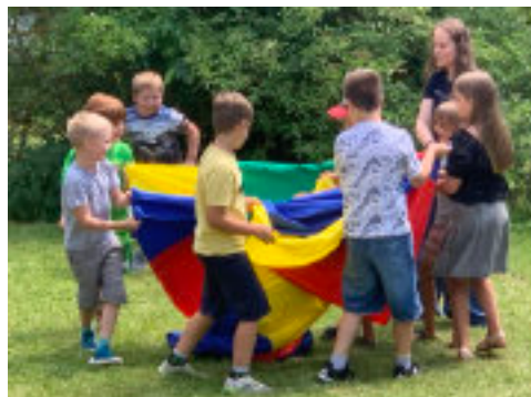
Ein Schwungtuch-Spiel für die Bewegungspause zwischendurch