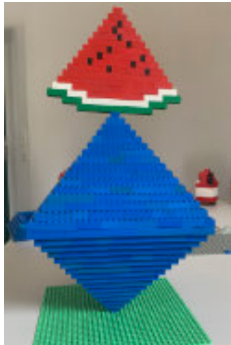
Immer schön die Balance halten! (Und bloß nicht am Tisch rütteln.)