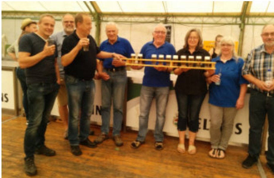
Der Posaunenchor pflegt die Geselligkeit und nach vollbrachtem Auftritt haben wir gegen ein Kaltgetränk nichts einzuwenden!

spielen, er wollte das kleinere Flügelhorn spielen. Grund war die Größe des Tenorhorns, da die Instrumente regelmäßig von den Spielern geputzt werden mussten. 1985 übernahm er in Ermangelung eines Chorleiters als „Spielertrainer“ die Leitung des Chores. Die Nachwuchsarbeit lag ihm sehr am Herzen und so begann eine Zusammenarbeit mit der Grundschule Oberelsungen, wo er im Rahmen des Musikunterrichts Blasinstrumente vorstellte und